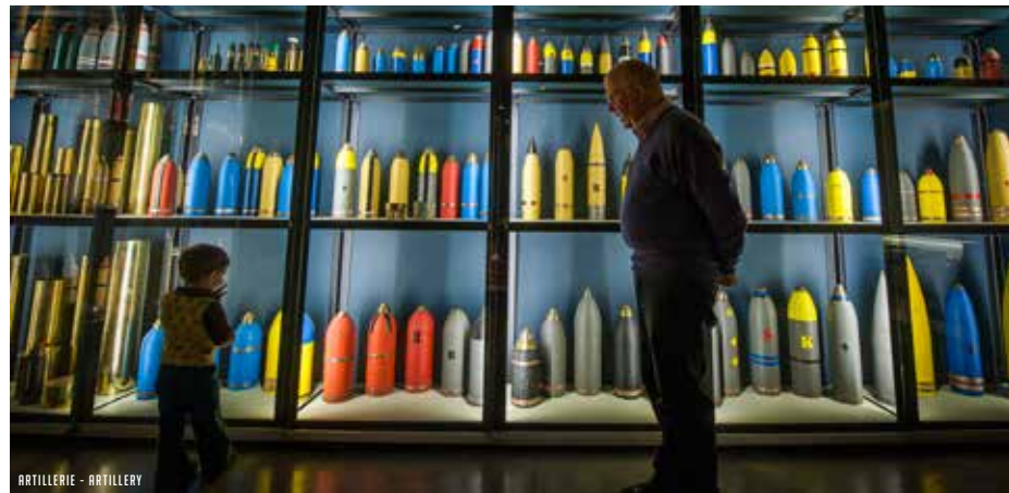
ARTILLERIE - ARTILLERY

Het Memorial Museum Passchendaele 1917 brengt op een aangrijpende en aanschouwelijke manier het historische verhaal van de Eerste Wereldoorlog met bijzondere aandacht voor de Slag van Passendale. Deze slag uit 1917 staat bekend als één van de gruwelijkste veldslagen uit de Eerste Wereldoorlog, met meer dan een half miljoen slachtoffers voor een terreinwinst van slechts acht kilometer. 'Passchendaele' werd niet alleen een begrip in de geschiedenis van de Eerste Wereldoorlog, het werd ook het symbool van de grote zinloosheid van het oorlogsgeweld in al zijn gruwel.