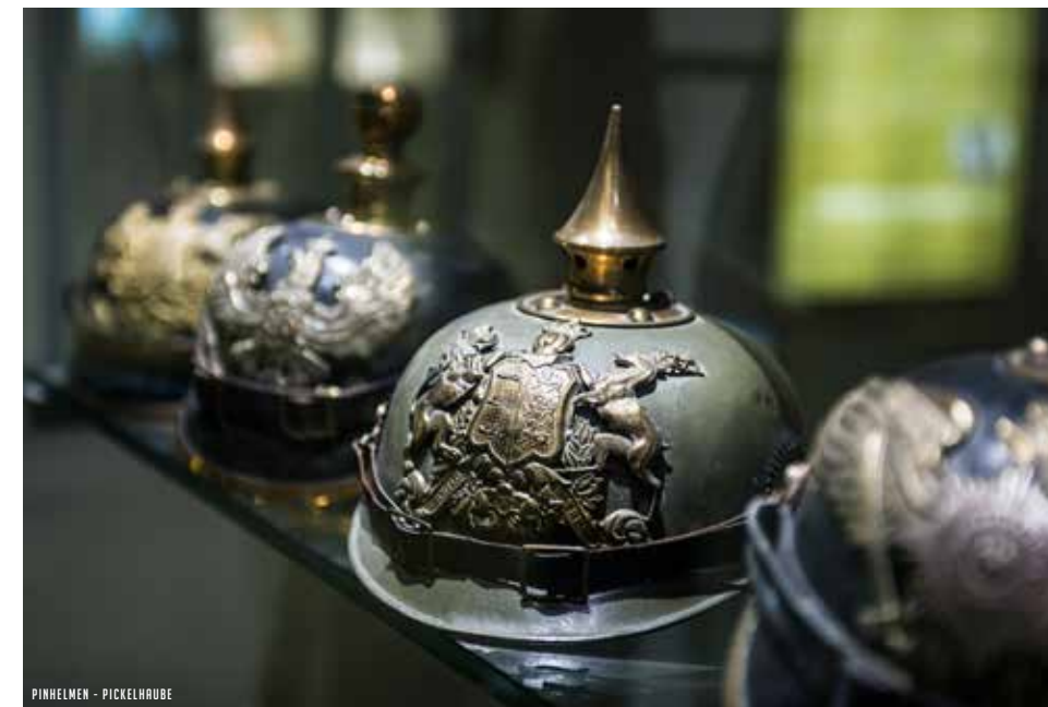
PINHELMEN - PICKELHAUBE

The museum section provides an overview of the five battles of Ypres, including the Battle of Passchendaele. Using historical objects, authentic letters, posters and other documents, uniforms of the various armies and video clips etc. both young and old get an insight into how life must