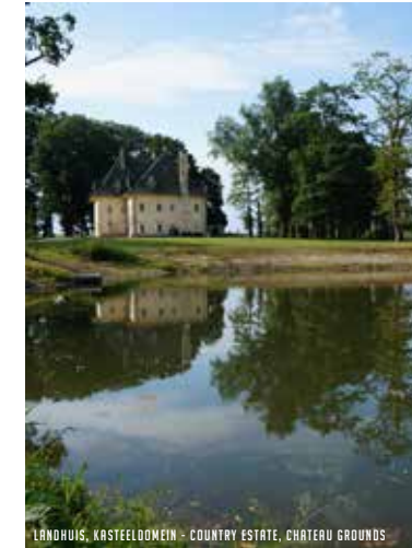
LANDHUIS, KASTEELDOMEIN - COUNTRY ESTATE, CHATEAU GROUNDS