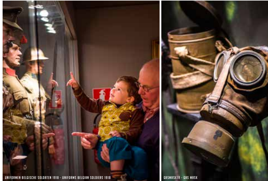
UNIFORMEN BELGISCHE SOLDATEN 1918 - UNIFORMS BELGIAN SOLDIERS 1918